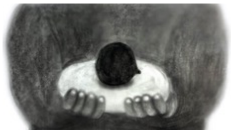
作品 2 : 『家の前に大きな木がある』 劉 軼男 (東京藝術大学)