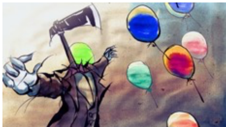
作品 1 : 『The Balloon Catcher』 金子 勲矩 (多摩美術大学)